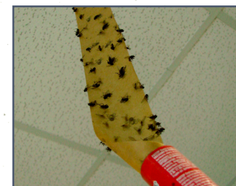
3. lep na muchy