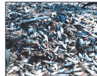
1. przyłów uzyskany podczas połowu krewetek