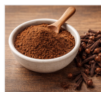
goździki 6 g