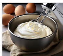
białko 100 g