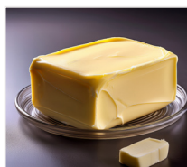
masto 250 g