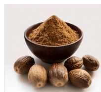
gałka muskatowa 4 g