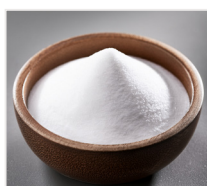
soda 35 g