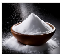
cukier puder 500 g