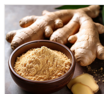
imbir 4 g