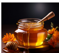
miód 400 g