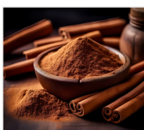
cynamon 7 g