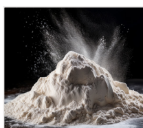
mąka 1,5 kg