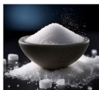
cukier 250 g