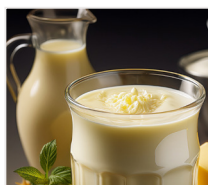
maślanka 0,5 litra