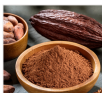
kakao 6 g