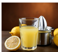
sok z cytryny 20 g