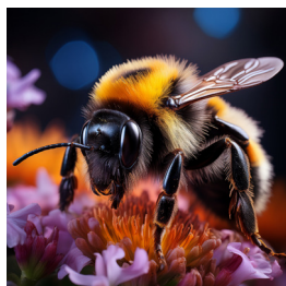
trzmieł / bąk